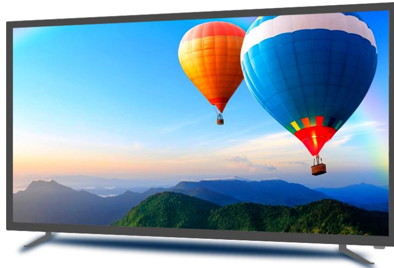
Venta de Electrodomésticos