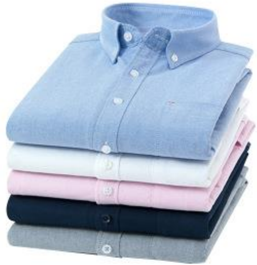
Almacenes de Ropa