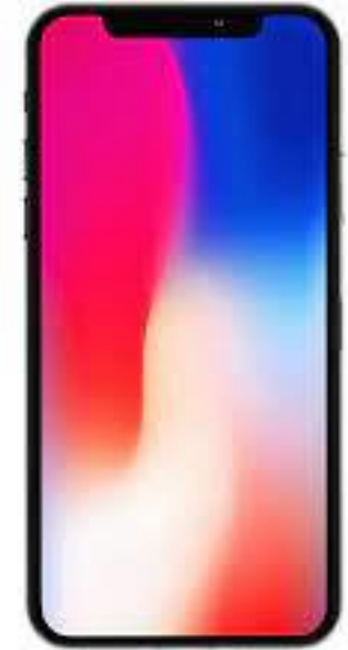
Venta de Celulares y Dispositivos Móviles