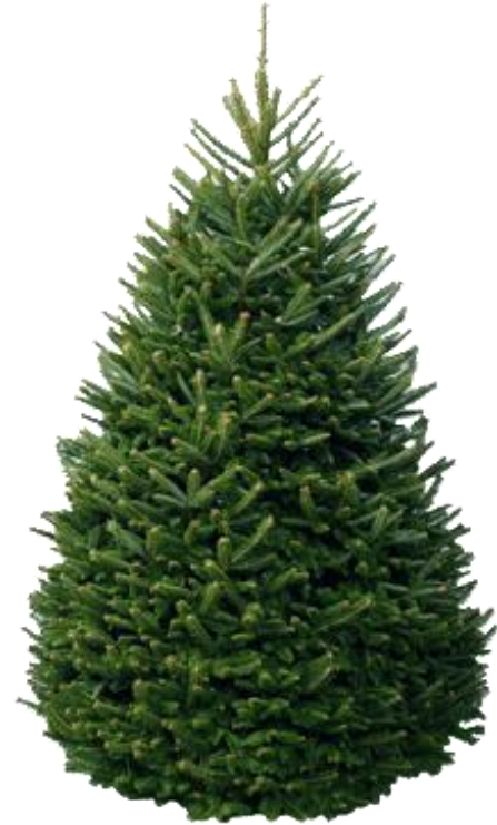
Ventas de Árboles Naturales