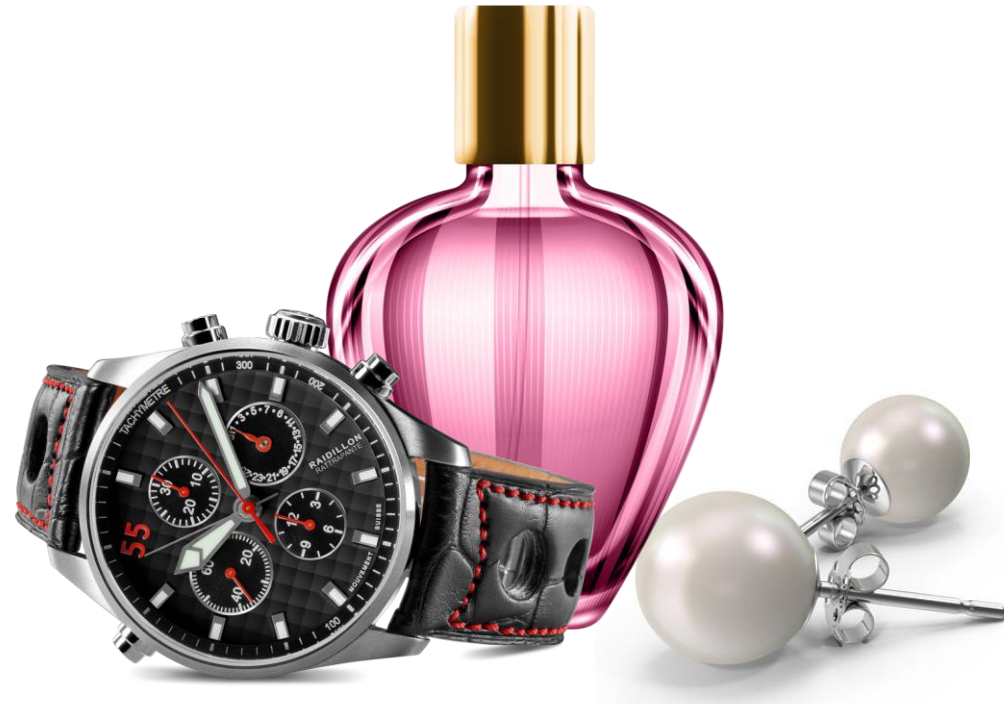
Relojerías, Perfumerías y Joyerías