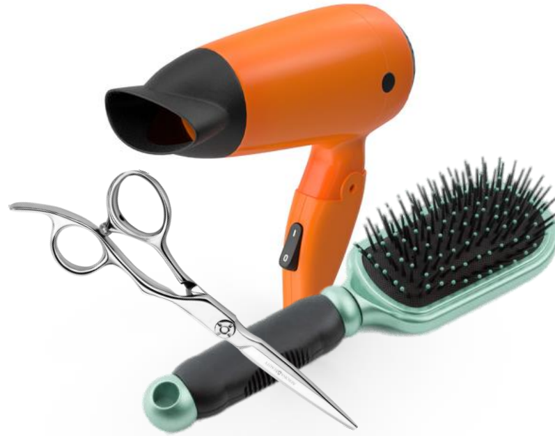
Salas de Belleza