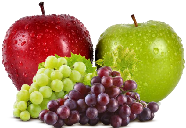
Depósitos de Venta Manzanas y Uvas