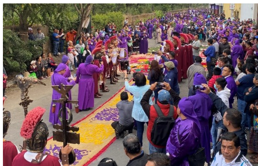
Paso de la Consagrada Imagen de Jesús Nazareno de la Caída por el Real Palacio de los capitanes en la Antigua Guatemala.