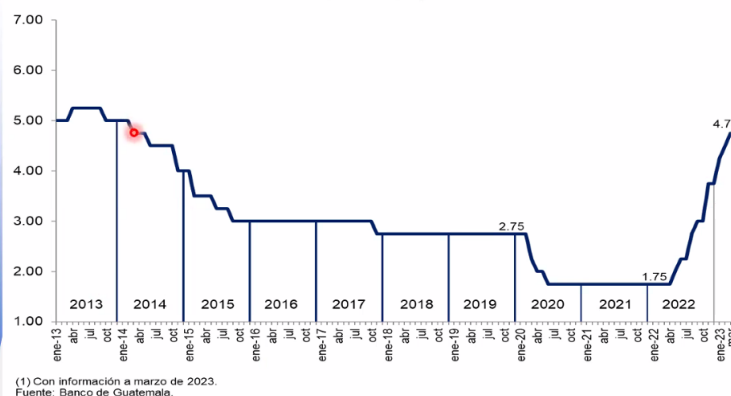
Tasa de Interés Líder de Política Monetaria (1) (Porcentajes)

En el ámbito interno, la Junta Monetaria resaltó que la mayoría de los indicadores de corto plazo de la actividad económica (IMAE, ingreso de divisas por remesas familiares y crédito bancario al sector privado, entre otros), continúan mostrando un comportamiento congruente con la proyección de crecimiento económico para 2023 (entre 2.5% y 4.5%). Por otra parte, destacó que la inflación se ubicó en 9.92% en febrero de 2023; sin embargo, subrayó que conforme las proyecciones de los departamentos técnicos del Banco de Guatemala, en marzo la inflación empezaría a disminuir. Lo anterior, como resultado, principalmente, de los aumentos en la tasa de interés líder de política monetaria, de una menor presión inflacionaria externa y de la disminución de las expectativas de inflación.