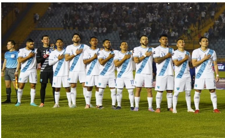
Tabla de Posiciones del Fútbol Nacional

La Selección de Fútbol de Guatemala tendrá la oportunidad de prepararse para la competencia con una serie de amistosos internacionales en los próximos meses. Además, el equipo deberá trabajar arduamente en la conformación de un plantel competitivo, para poder hacer frente a los equipos más fuertes de la región.