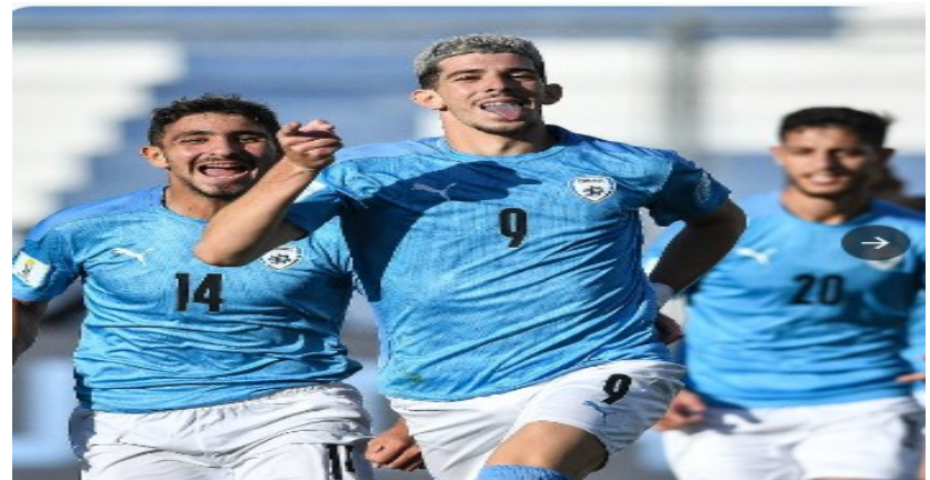
elimina a Brasil

El argentino Alejandro Garnacho ingresó en el minuto 61 por Christian Eriksen y casi marca el empate con un remate cruzado, Es la segunda FA Cup para el City desde que está Guardiola, tras la que lograron en 2019 en la que golpearon al Watford.