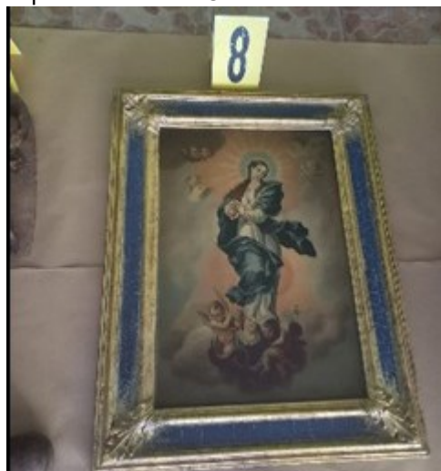
Entre la evidencia incautada están:

La Fiscalía contra el Crimen Organizado del Ministerio Público (MP) informó en abril de este año, que estos criminales se cubrían totalmente el rostro y usaban guantes al ingreso a las viviendas. La estructura criminal ingresa a las viviendas, toma el control de los ciudadanos dentro de los domicilios. Sin embargo, algunos de ellos se han convertido en violentos durante los hechos. Las autoridades recuperaron vehículos, droga e incautado evidencia como una corona de espinas muy antigua que fue robada en Antigua, Guatemala. Entre las obras recuperadas está la Oración en el Huerto.