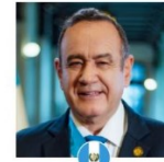
ALEJANDRO GIAMMATTEI PRESIDENTE DE GUATEMALA