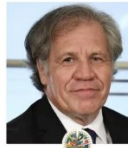
LUIS ALMAGRO SECRETARIO GENERAL OEA

f t i y Síguenos como Gobierno de Guatemala