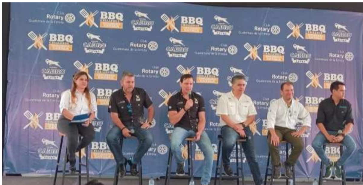
Presidente de Club Rotario Guatemala de la Ermita

Este evento va más allá de ser una simple competencia de parrilleros; es una celebración de la unión, la generosidad y la pasión por hacer el bien. Sesenta equipos, conformados por aficionados y profesionales de la parrilla, se reunirán para mostrar sus habilidades y compartir sus recetas más deliciosas. Desde jugosas carnes hasta exquisitos platos de queso, para satisfacer todos los paladares y garantizar una experiencia gastronómica inolvidable.