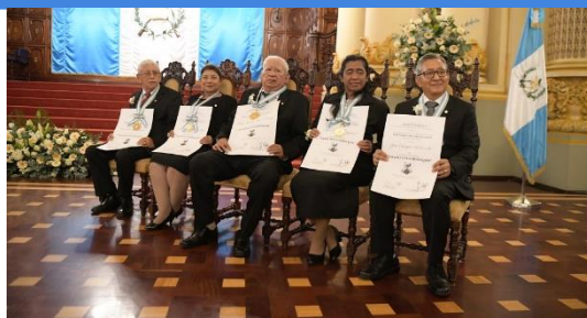
Los maestros condecorados en esta ocasión fueron: