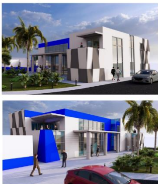
Ampliación Edificio Administrativo

Esta iniciativa forma parte de las acciones para modernizar de manera integral el servicio aduanero y de comercio exterior, y tiene como objetivo mejorar las condiciones laborales del personal de aduanas.