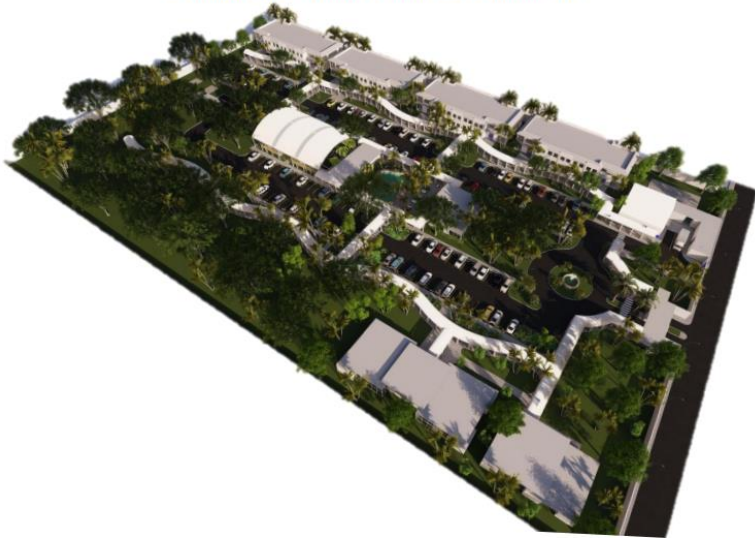
Complejo Habitacional y Centro de Capacitaciones

Entrega de escritura pública de usufructo a favor de SAT para construcción del complejo habitacional Aduana Puerto Quetzal.