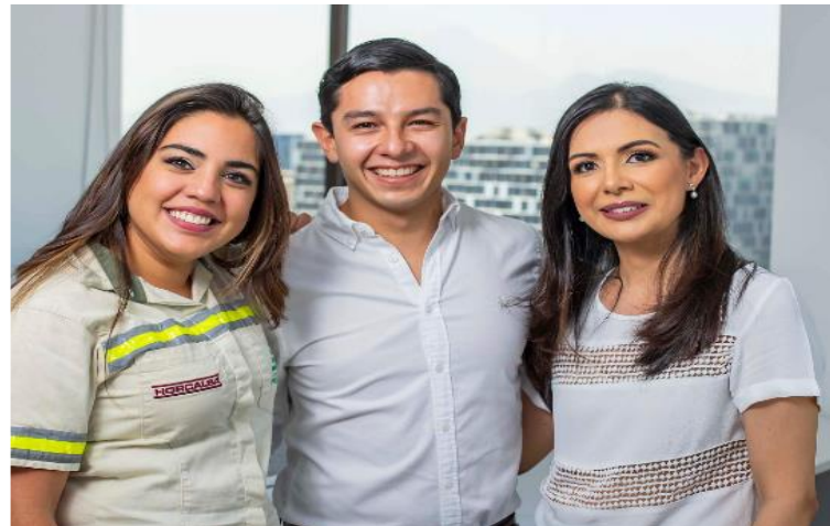
Cementos Progreso Holdings, S.L. Participación femenina en la estructura laboral, 2023

Bajo la premisa de la importancia del capital humano y de un trabajo digno, en Cementos Progreso, la centenaria empresa guatemalteca, promueve dentro de sus pilares de sostenibilidad “ser empleador favorito”, y por ello desde la gerencia de Cultura y Desarrollo Organizacional se busca ser un lugar excepcional para trabajar. Cementos Progreso a nivel regional, promueve una política laboral que se basa en igualdad de oportunidades y en la meritocracia. Desde esta perspectiva, las mujeres tienen un papel importante en el grupo.