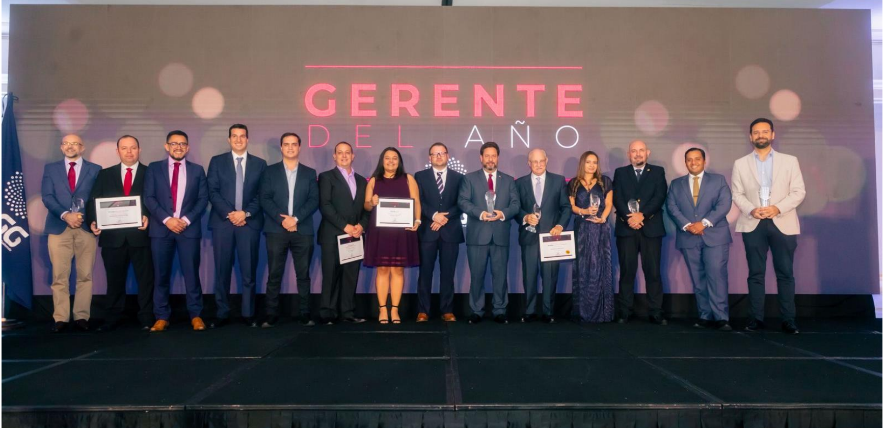
Ganadores del Galardón Gerente del Año 2024 anunciados por la Asociación de Gerentes de Guatemala