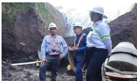
Los trabajos que se realizan en cada uno de los puntos incluyen:

Los trabajos de rehabilitación de la autopista Palín-Escuintla cuentan con múltiples cuadrillas de personal especializado, maquinaria pesada como excavadoras, retroexcavadoras, equipo de bombeo de concreto, cargadores frontales y camiones de volteo, evidenciando el compromiso que mantiene esta cartera con rehabilitar esta vía de comunicación.